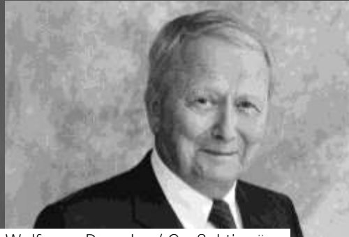
Wolfgang Porsche / Großaktionär