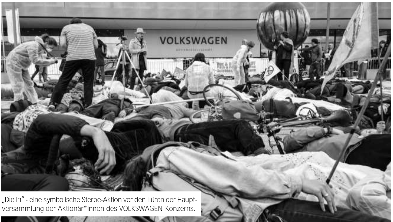
„Die In“ - eine symbolische Sterbe-Aktion vor den Türen der Hauptversammlung der Aktionär*innen des VOLKSWAGEN-Konzerns.

In der Woche vor der VW-Hauptversammlung fand in Düsseldorf eine Diskussionsveranstaltung mit Blue Planet Preisträger Huberto Juárez Núñez statt. Es ging um die globale Bedeutung von VOLKSWAGEN