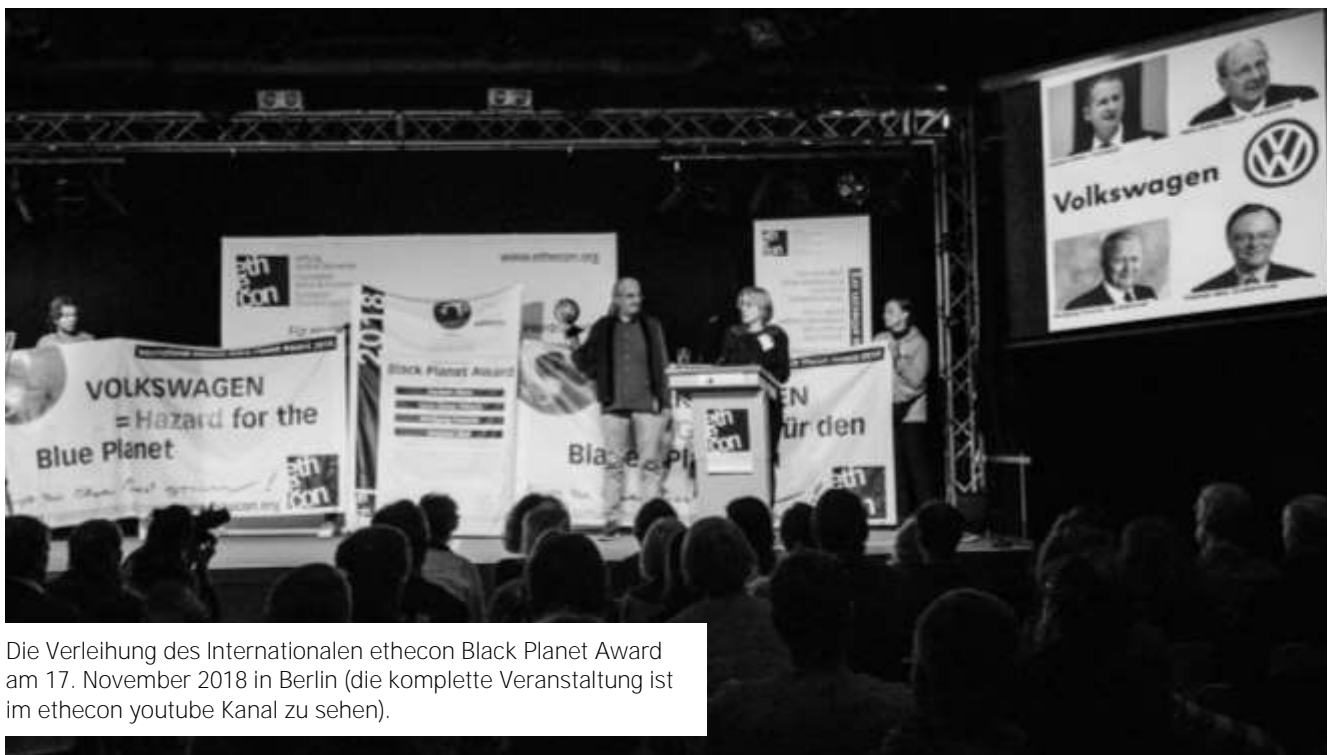
Die Verleihung des Internationalen ethecon Black Planet Award am 17. November 2018 in Berlin (die komplette Veranstaltung ist im ethecon youtube Kanal zu sehen).

Eine geeignete Möglichkeit für die Übergabe des Internationalen ethecon Black Planet Award an die Vorstände Herbert Diess und Hans Dieter Pötsch sowie die Großaktionäre Wolfgang Porsche und Stephan Weil des Automobil-Konzerns VOLKSWAGEN bot sich mit der Hauptversammlung des VW-Konzerns am 14. Mai 2019. Nicht nur würden dort die genannten Preisträger*innen allesamt persönlich anwesend sein, die Veranstaltung würde im breiten Interesse einer vieltausendköpfigen Aktionärsschaft sowie der