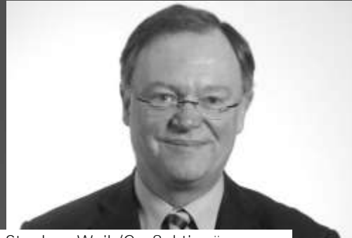
Stephan Weil / Großaktionär